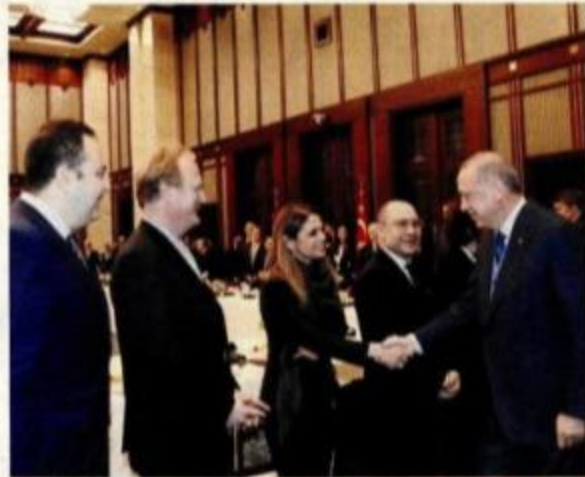
President Recep Tayyip Erdoğan met with the members of the American-Turkish Council and American Chamber of Commerce Turkey on Feb. 7, 2019 and launched the initial phase of a program to triple the bilateral trade volume with the U.S.

On Feb. 4-8, a delegation of 52 American businesspeople visited the Turkish capital, Ankara, and met their Turkish counterparts. Discussions were