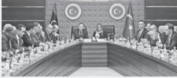
Ticaret Bakanı Ruhsar Pekcan ve Libya Ulusal Mutabakat Hükümeti Planlama Bakanı Taher Jehaimi başkanlığında "Türkiye-Libya Müteahhitlik Ortak Çalışma Grubu" toplantısı, 31 Ocak 2019 tarihinde Ankara'da gerçekleştirildi.

Ticaret Bakanı Ruhsar Pekcan, toplantıda yaptığı konuşmada, Türk Hükümeti olarak, Libya ile ticari ve ekonomik ilişkilerin gelişmesine büyük önem verdiklerini belirterek, iki ülke