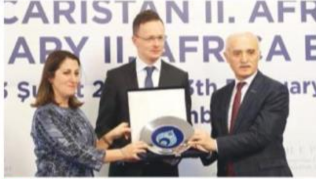
DEİK Türkiye-Macaristan 2. Afrika İş Forumu, İstanbul'da düzenlendi. Forumu, Ticaret Bakan Yardımcısı Gonca Yılmaz Batur'un yanı sıra, Macaristan Dışişleri ve Dış Ticaret Bakanı Peter Szijarto (ortada) ve DEİK Başkanı Nail Olpak da katıldı. Batur ve Olpak katılmadan dolayı, Szijarto'ya teşekkür hediyesi takdim etti.

Bakan yardımcısı Batur, Türkiye olarak Afrika'nın bu kalkınma serüveninde önemli bir partner olarak yerlerini aldıklarını anlatarak, "Afrika ile ticaretimizde adil ticaret ilkesini benimsedik" dedi. Şu an itibarıyla Afrika'da 42 ülkede büyükelçilik, 26 ülkede ticaret müşavirliği bulunduğularının bilgisini veren Batur, yoğun çalışmaların sonucu olarak, 2003 yılında Afrika Kıtası ile 5,4 milyar dolar olan ticaret hacminin 2018 yılında 23,8 milyar dolara ulaştıklarını belirterek, "Firmalarımız, 24 bini aşkın Afrika