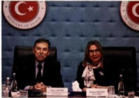
The Turkish-Libyan Contracting Joint Working Group's meeting was held under the chair of Trade Minister Ruhsar Pekcan (R) and Planning Minister of Libyan Government of National Accord Taher al-Jehaimi in Ankara, Jan. 31, 2019.

Held at the Trade Ministry headquarters, the meeting was attended by the Turkish Contractors Association, Foreign Economic Relations Board (İSİRK) Turkey-Libya