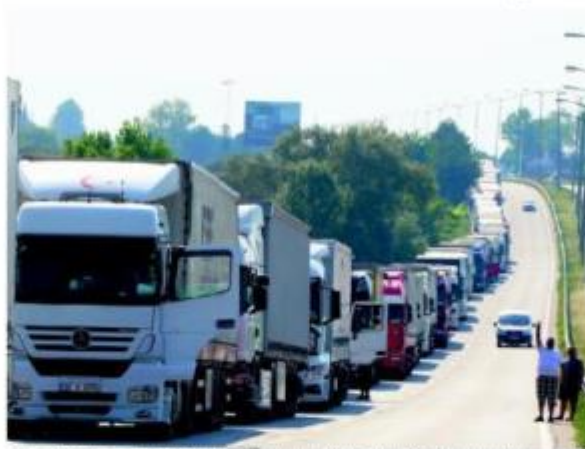
A view of the 9-km queue of Turkish trucks of the Kapıkule Border Gate, waiting for passage to carry export goods to Europe.

Representatives from the Turkish business world emphasize the necessity to upgrade the current deal as it excludes major areas of economic