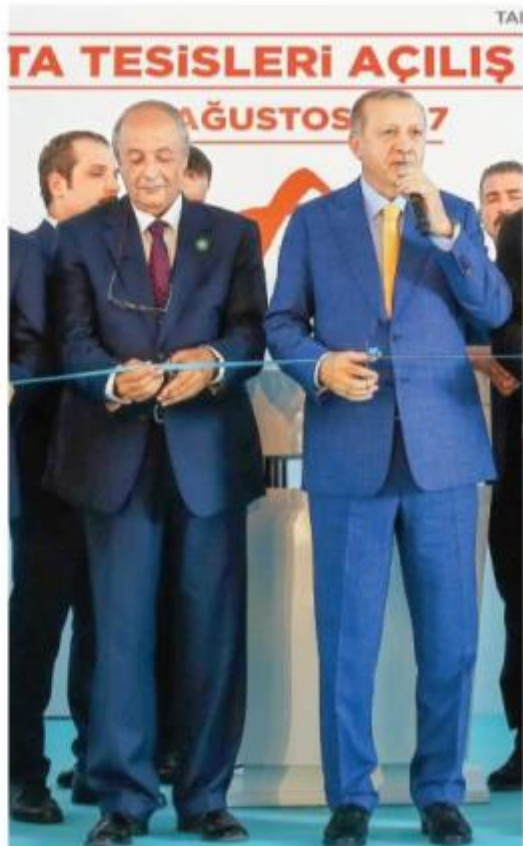
Açılışta Cumhurbaşkanı Erdoğan, Gıda Bakanları Fikri İbrahimođlu, Dışişleri Bakanı Çavuşođlu, Ekonomi Bakanı Zeynepci, Ada Bakanları Kaya, Spor Bakanları, Anadolu Grubu Başkanı Muhtar Kent'in yanı sıra pek çok kişi yer aldı.

Coca-Cola İçecek CEO'su Blake Beyer de 15 Temmuz'dan sonraki hafta verdiğimiz kararla sadece bir süre içerisinde 110 milyon TL yatırım ile Isparta fabrikasını tamamladığımızı söyledi. Türkiye'nin sahip olduğu Ortadoğu ve Afrika'da 10 ilde 25 fabrika ve 10 bin çalışanıyla faaliyet gösteren bölgedeki en büyük Türk yatırım alanı bir diğer önemli alan olan Isparta, 'İsparta kapısı' olarak değerlendirilmekte. Türkiye'nin en hızlı büyüyen sektörleri arasında su tüketim sektörü de yer alıyor. 1 milyar 500 milyon dolar yatırım yapan Anadolu Grubu, Coca-Cola İçecek ve Anadolu Etap ile birlikte iki yeni tesis açıyor daha. İsparta'da açılan, Cumhurbaşkanı Recep Tayyip Erdoğan'ın katılımıyla gerçekleştirilen törenin açılışına, Ekonomi Bakanı Nihat Zeynepci, Gıda, Tarım ve Hayvancılık Bakanı Ferið Fikri İbrahimođlu, Dışişleri Bakanı Mevlüt Çavuşođlu, Ormanlık ve Spor Bakanı, Ada ve Sosyal Politikalar Bakanı Fatma Söğüt Sıyan Kaya, Sağlık Bakanları Özkan Çoban ve Mustafa , Başbakanlık, Yürütme Kurulu Başkanı Arslan Ersoy da katıldı. Coca-Cola İçecek, 110 milyon liralık yeni yatırımına hazırladığı Türkiye'deki 10'uncu fabrikasını 150 bin metrekare alanda