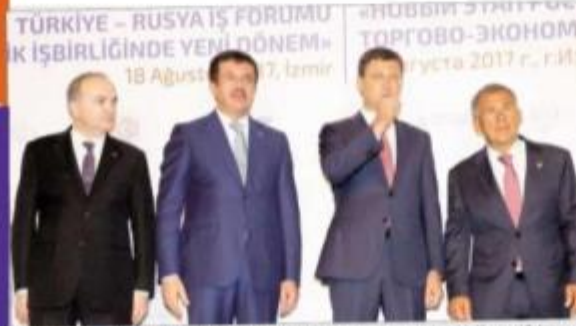
Türkiye-Rusya İş Forumu'na Tataristan Cumhurbaşkanı Rustem Minnikanov (sağda), Ekonomi Bakanı Nihat Zeybekci (sol 2), Sanayi Bakanı Faruk Özlü (sola) ve Rusya Enerji Bakanı Aleksandr Novak katıldı.

İzmir Fuarı'nın partner ülkesi olan Rusya'na, geniş katılıma ve çok sayıda ile İzmir'e gelmelerinin iki ülke ilişkilerine verdikleri önemin büyük göstergesi olduğunu vurgulayan Bilm, Sanayi ve Teknoloji Bakanı Faruk Özlü de, "Bu iki ülkenin işbirliğinin, geçmişte olduğu gibi gelecekte de önemini artıracaktır. Türkiye ve Rusya'nın ilişkisi, komşu olanın ötesinde sıradan ajan anlaşılır kapsamdadır. Türkiye ve Rusya hem bölgesel hem de küresel açılan bölgelerini etkileyen, yön veren, destekleyen ve anlayan iki ülkedir" ifadelerini kullandı.