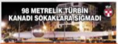
Fuarda yenilenebilir enerjiye ilgiyi artırmak için sergilenen 98 metrelik dev rüzgar türbini Kanada ve rüzgar türbini kulesi, trafik polislerinin kontrolünde THY'larla hıyar alınması getirildi.

Türkiye ve Rusya arasındaki işbirliğinin çok boyutlu olduğunu kaydeden Novak, "Ziraat, inşaat ve turizm sektörlerinde de çalışmalar yapılıyor. Tüm bunların işbirliğine büyük katkı sağlanacağına eminim. Rusya'nın İEP'de partner ülke olması çok güzel bir imkân yaratmaktadır" dedi.