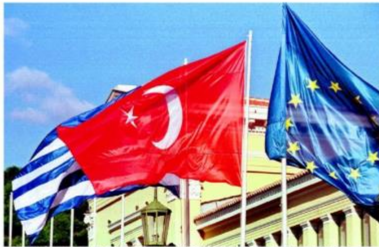
As the only non-EU member country that has a customs union agreement with the EU since 1996, Turkey has been proven a strong trade partner to the union.

Turkish authorities have criticized German Chancellor Merkel's remarks on not expanding the EU customs union deal with Turkey, in what they call Germany's monopoly over EU institutions