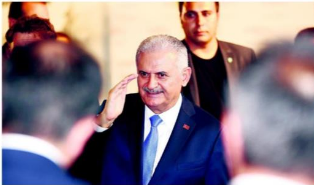
During his Singapore and Vietnam visit, the prime minister will be accompanied by ministers and business figures to attend forums organized by Turkey's Foreign Economic Relations Board (DİİBK) in cooperation with the Ministry of Economy.

Turkey seeks to strengthen its ties in the Asia-Pacific region regardless of its physical distance to the region, and as a part of this multidimensional foreign policy, Prime Minister Yıldırım is expected to visit Singapore on Aug. 21-22 and Vietnam on Aug. 22-24, which will be the first time a Turkish prime minister has visited Vietnam