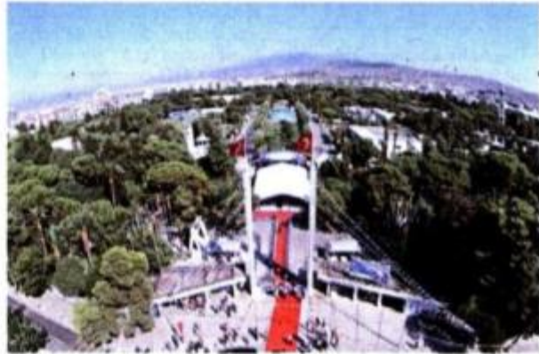
The main theme of the Izmir International Fair, which will be organized for the 86th time at the city's fair grounds, will be energy this year.