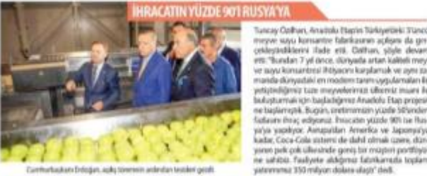
Cumhurbaşkanı Erdoğan, açık törenin ardından tesisleri gezdi.

■ The Coca-Cola Company Yatırım Kurulu Başkanı Muhtar Kent bu Coca-Cola sistemi olarak Türkiye'nin büyüyen ve gelişen bir pazar olduğunu belirtti. 'Bu süreçte ortaklarımız ve Türkiye'nin potansiyelini olan manevra ile yatırım devam etti' dedi. Türkiye'nin 200 bin hektarlık alanı olan Isparta'da açılan Coca-Cola operasyon alanlarında önemli bir yatırımın yapıldığını belirtti. 'Bu yatırımın sadece suyun değil, aynı zamanda meyve ve diğer ürünlerin de kalitesini artırarak, çiftçilerin gelirlerini artırarak, Türkiye'nin manevra alanını genişlettiğini belirtti. 'Bu yatırımın sadece suyun değil, aynı zamanda meyve ve diğer ürünlerin de kalitesini artırarak, çiftçilerin gelirlerini artırarak, Türkiye'nin manevra alanını genişlettiğini belirtti.