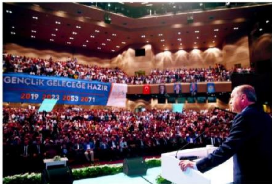
President Erdoğan said yesterday that anyone who wants to see the games of the West played in the region should look at the power distribution in Syria and Iraq.

"Unfortunately, each and every terrorist organization takes control over from the other and there is serious instability," Yıldırım said during a news conference at Ankara's Esenboğa Airport ahead of a visit to Singapore and Vietnam, adding that the innocent people who live in these places and Turkey