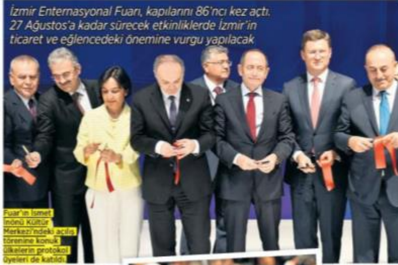
Izmir Enternasyonal Fuarı, kapılarını 86'ncı kez açtı. 27 Ağustos'a kadar sürecek etkinliklerde İzmir'in ticaret ve eğlencedeki önemine vurgu yapılacaktır.

Fuar'ın İsmet İnönü Kültür Merkezi'ndeki açılış törenine konuk ülkelerin protokol üyeleri de katıldı.