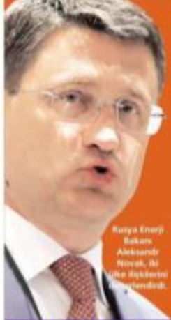
Rusya Enerji Bakanı Aleksandr Novak, 18 Ağustos'ta İzmir'de.

RUSYA ENERJİ BAKANI NOVAK, İZMİR'DE TÜRKİYE-RUSYA İŞ FORUMU'NDA KONUŞTU: