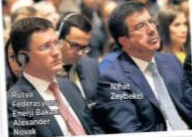
Rusya Federasyonu Enerji Bakanı Aleksandr Novak

Rusya'nın fuara partner ülke olması için ısrarcı olduğunu belirten Zeybekci, "Rusya ve