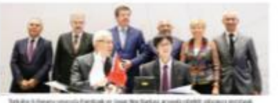
Türk-Alman ortaklığı altındaki IZMİR Fuarı kapsamında 300 Türk iş adamı ile 250 Alman iş adamının bir arada fotoğrafı çekildi.

Avrupa Komisyonu Başkanı Jean-Claude Juncker, "Türkiye ile Gümrük Birliği anlaşması güncellenmeyecek" açıklamasına "İki taraf da kaybeder" sözleriyle değerlendirdi. Juncker, "Türkiye ile Gümrük Birliği anlaşması güncellenmeyecek" açıklamasına "İki taraf da kaybeder" sözleriyle değerlendirdi.