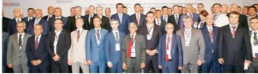
Izmir Enternasyonal Fuarı kapsamında düzenlenen Türkiye, Almanya ortaklığı altındaki IZMİR Fuarı kapsamında 300 Türk iş adamı ile 250 Alman iş adamının bir arada fotoğrafı çekildi.