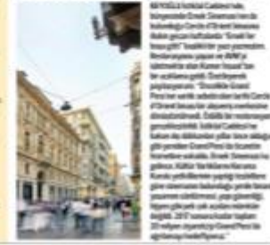
2017 yılında Grand Pera'da 20 milyon ziyaretçiyi ağırlayacağız.