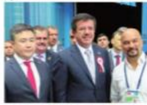
Kazakistan'ın "Ticaret 2017" düzenlenirken enerji forumuna katılan Türk işadamları. Kazakistan'ın başkenti Astana'ya düzenlenen enerji forumuna katılan Türk işadamlarının bu ülkeye ilgisi yeniden arttı.

100'ün üzerindeki işadamları ile Kazakistan'ın başkenti Astana'ya düzenlenen enerji forumuna katılan Türk işadamlarının bu ülkeye ilgisi yeniden arttı. Türk işadamları bir dönem PETO etkisi yüzünden iyipaymaktayken sonradan Kazakistan'da 3 milyar dolar olan ticaret hacminin artacağı görüldü.