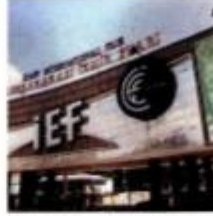
The main entrance of the venue where the Izmir Fair will be held.