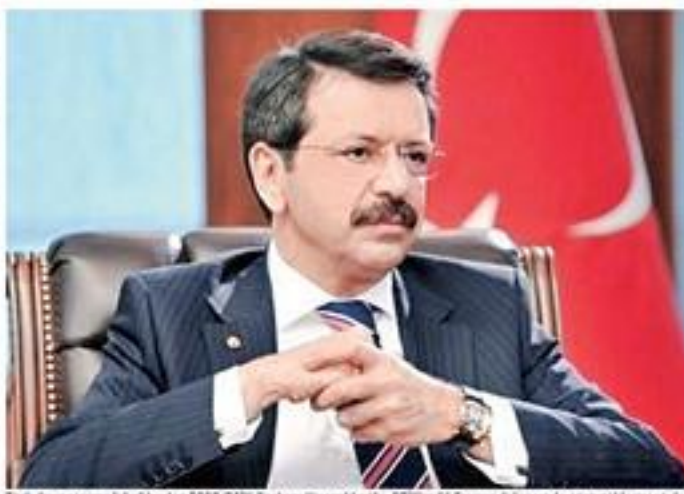
Türk diasporasına liderlik eden TOBB/DEİK Başkanı Hisarcıklıoğlu, DTİK'nin 55 Fransız delegesiyle görüşmelerini yapıyor.

Önki Fransız dışişleri Voltaire'in bir sözüne atıfta bulunan Hisarcıklıoğlu, "(Dünyacılara karşıyım ancak düşüncelerinizi savunmak için ölmeye hazırım) diyen bir dışişleri Voltaire'in Fransızca'da bu tür bir yasa teklifinin gündeme gelmesini hayretle