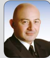
Ferit F. Şahenk

Yönetim Kurulu Üyesi, Dış Ekonomik İlişkiler Kurulu (DEİK), Başkan, Ege Bölgesi Sanayi Odası, Board Member, Foreign Economic Relations Board (DEİK), Chairman, Aegean Region Chamber of Industry