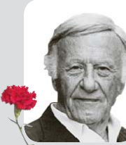
Dr. Nejat Eczacıbaşı

Yönetim Kurulu Başkanı / Chairman Tekfen Holding A.Ş.