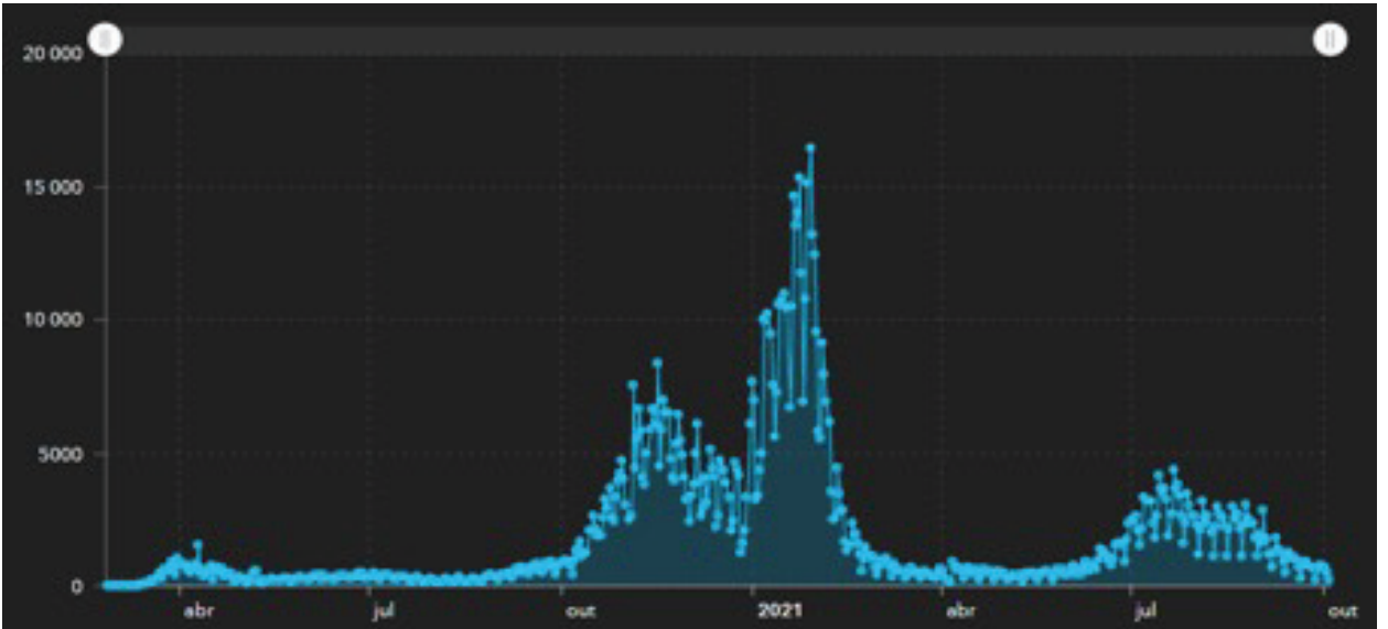
Yeni vakaların gelişimi (günlük)