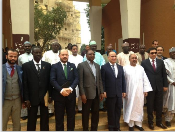
Türkiye-Nijer İŐ Konseyi iki taraf