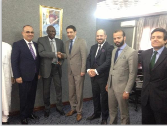
Ekonomi Bakanı Saidou Sidibe