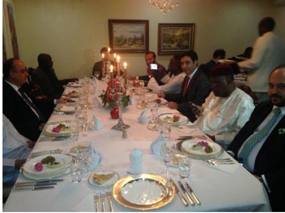
Sayın Büyükelçimizin rezidansında yemek