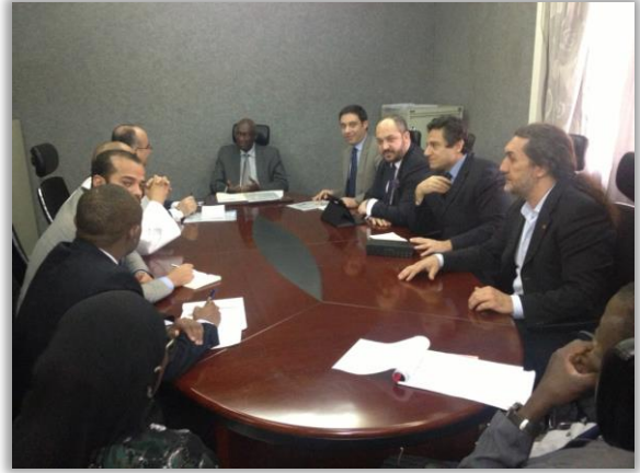
Ekonomi Bakanı Saidou Sidibe ile toplantı