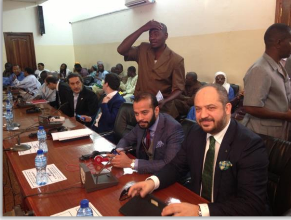
İŐ Konseyi KuruluŐ Toplantısı