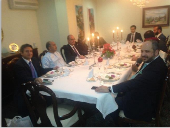
Sayın Büyükelçimizin rezidansında yemek