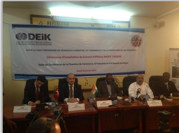
İŐ Konseyi Kuruluş Toplantısı